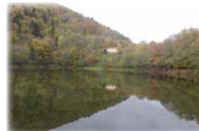
Wandern und Singen SONNTAG, 18. Juni 2023 Lachtelweiher und Baerenkopf