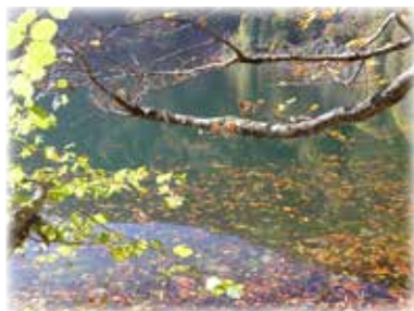
Samstag, 8. Juli 2023 Lac des Perche