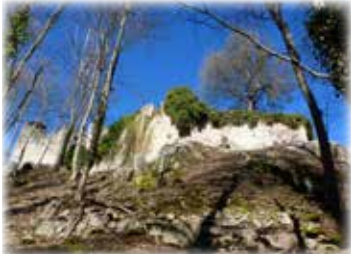
Samstag, 14. Oktober 2023 Pflixbourg und Hollandsbourg