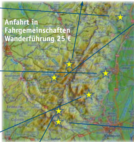
Anfahrt in Fahrgemeinschaften Wanderführung 25 €