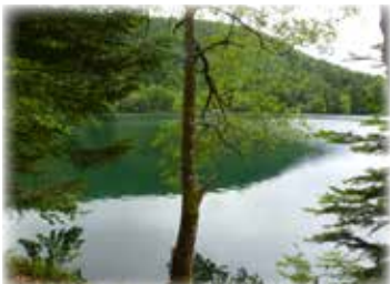
Samstag, 16. September 2023 Lac du Ballon