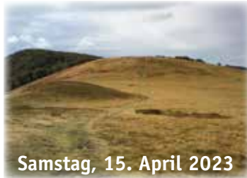
Samstag, 15. April 2023 Petit und Grand Hohneck