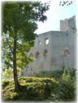
Samstag, 11. März 2023 Andlau und seine Burgen