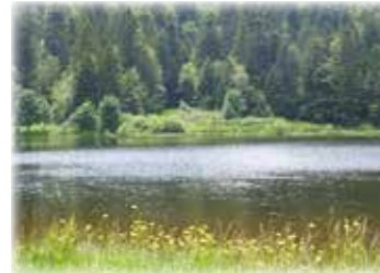
Samstag, 20. Mai 2023 Lac de Blancheimer